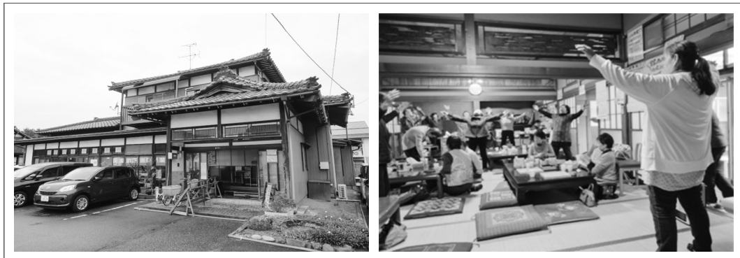
| 그림 1. 민가를 활용한 지역주민 커뮤니티 공간 차노마 모습 |

출처: “有償で支えあう「茶の間」、行政と連携して高齢者の居場所を”, 井上俊明, 2020. 1. 28, 日経BP(Nikkei Business Publications, Inc.) https://project.nikkeibp.co.jp/atclppp/PPP/434167/010900138/?P=2